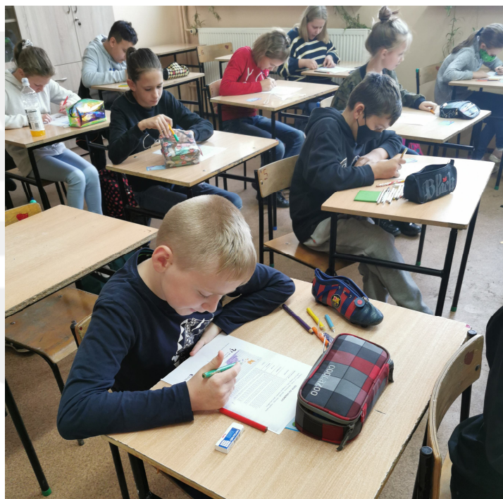
Klasa VI b podczas zajęć

Żyjemy w globalnym świecie, w którym życie każdego człowieka nieodwracalnie powiązane jest z życiem całej naszej planety. Nie możemy uniknąć tych współzależności, jednak często trudno dzieciom i nam dorosłym je zrozumieć. W celu informowania o tym, jaki nasz świat jest obecnie, ale także kształtowania postaw, które pomogą nam uczynić go bardziej sprawiedliwym w przyszłości, uczniowie klas III a, VI b i VII b, pod okiem wychowawców, biorą udział w programie Polskiej Akcji Humanitarnej „Godziny Wychowawcze ze Świa-